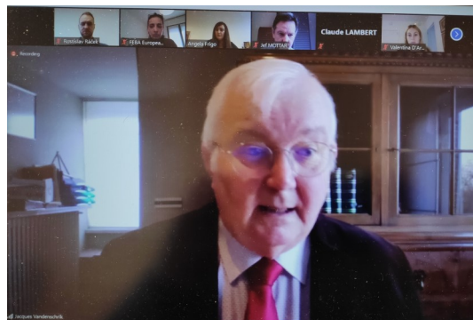
President FEBA Jacques Vanden-schrik na virtuálním zasedání Valné hromady

Po více než 20 letech se od souhlasení změnila Charta potravinových bank, která lépe reflektuje současný stav a bude tak efektivnější při boji proti plýtvání potravinami. Hlasování se účastnilo 53 členů z celkového počtu 57 oprávněných hlasujících.